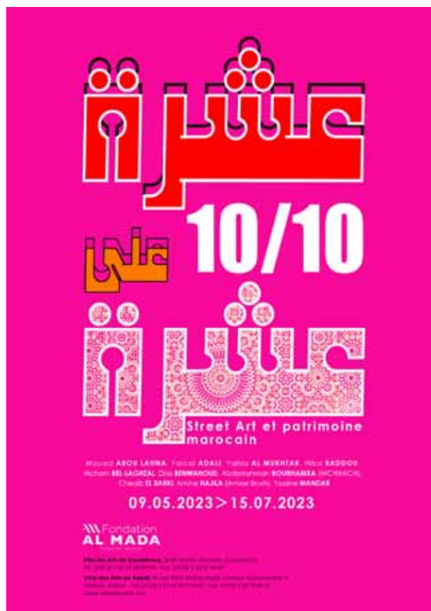
Table ronde et rencontre avec les artistes en marge de l'exposition 10/10

Cette exposition rend hommage à cet art populaire, accessible et offert à tous. Il faut savoir que la volonté première de la Fondation Al Mada est de montrer que les œuvres des street-artistes méritent leur place dans les musées. Il faut dire que l'art urbain incarne la liberté d'expression depuis des dizaines d'années et permet une prise de conscience renouvelée des grands enjeux sociétaux. Si ce mouvement a trouvé sa pleine reconnaissance sous la plume des journalistes et dans son accueil au sein des collections des musées, l'art urbain tire bel et bien son origine de la rue et continue de s'y exprimer sur les murs et autres supports urbains.